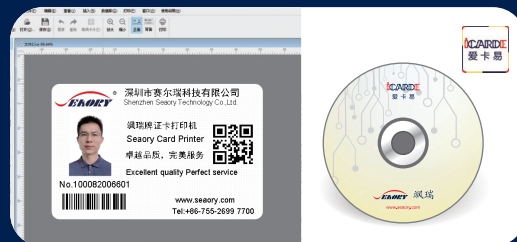
随机附赠专业打印软件